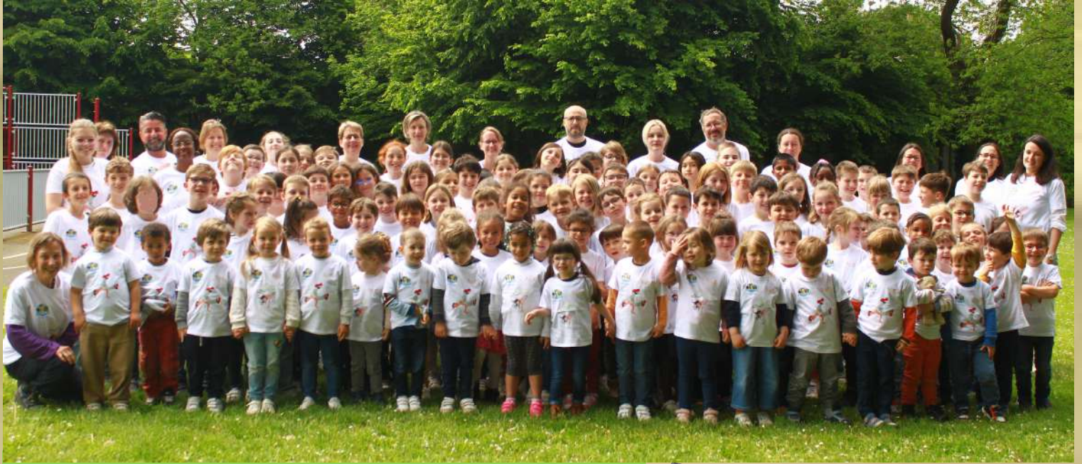
TOUS AVEC LE TEE-SHIRT DE BREAKDANCE