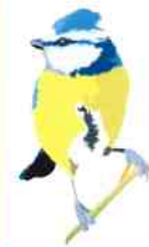
LA MÉSANGE BLEUE