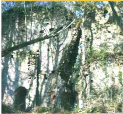
Les ruines du château

12 sentiers de randonnée pédestre "A LA RECOUVERTE DU PAYS D'AUBIGNÉ"